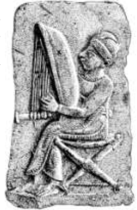
Die Psalmen wurden ursprünglich gesungen, möglicherweise auch begleitet von Instrumenten wie dieser Leier.

Steht auf für Gerechtigkeit - Weltgebetstag am 2. März aus Malaysia